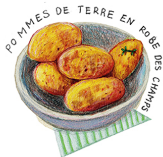
POMMES DE TERRE EN ROBE DES CHAMPS