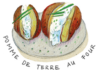
POMME DE TERRE AU FOUR