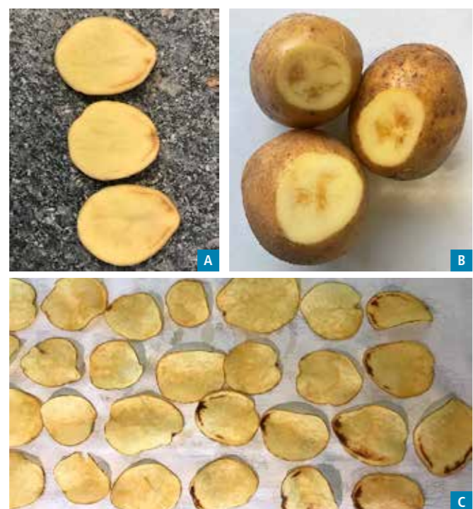
Figure 4 | De fortes concentrations de l'agent pathogène de la verticilliose ( Verticillium dahliae Kleb.) ont été trouvées dans la zone brune ou grise des vaisseaux vasculaires du côté du talon des tubercules. Ces zones deviennent noires lors du test de cuisson pour la friture. Les variétés industrielles Fontane, Pirol, SH C 1010 et Lady Alicia (variété dans les essais principaux) étaient particulièrement affectées en 2020 et 2022.