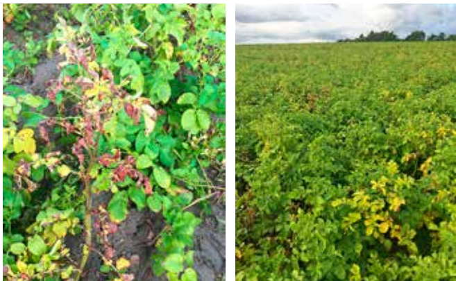
Figure 3 | La verticilliose ( Verticillium spp.) et la dartoïse ( Colletotrichum coccodes ) peuvent se développer après une période très chaude et sèche. Les deux maladies peuvent se manifester simultanément sur la même plante. Ces champignons sont présents dans le sol et contaminent les plantes par les racines et les tiges. Dans ce champ d'Agria, quelques plantes ont jauni prématurément en août et ont ensuite dépéri. Le nombre de plantes atteintes peut s'accroître rapidement au niveau de la parcelle.

En 2017 déjà, quelques cultures avaient jauni ou bruni prématurément (fig. 3). Une moitié du feuillage avait flétri et s'était desséchée sur quelques plantes. Les jours suivants, le phénomène s'était propagé à d'autres plantes dans la parcelle. Dans ces cultures, le calibre souhaité n'était malheureusement pas encore atteint, malgré un arrosage suffisant. Après diagnostic en laboratoire, les agents responsables de la verticilliose ( Verticillium spp.) et de la dartoïse ( Colletotrichum coccodes ) ont pu être identifiés. Ces deux maladies peuvent se manifester séparément ou simultanément.