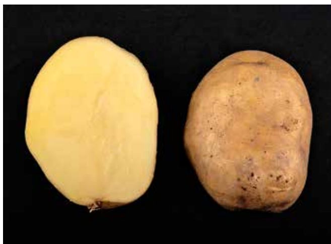
Figure 1 | Acoustic est une variété de consommation de type culinaire B avec un bon potentiel de rendement. Acoustic a été sélectionnée par la maison Meijer aux Pays-Bas. Cette variété a une très bonne résistance au mildiou du feuillage et nécessite moins de traitements fongiques durant la période de végétation. Elle est de forme oblongue courte à ronde et moyennement sensible aux autres maladies.

Une variété peut se situer entre deux types culinaires: la première lettre indique alors le type culinaire prédominant. Par exemple, une pomme de terre de type culinaire B-C est moins farineuse et plus ferme qu'une autre de type C-B.